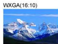
顯示完全自然尺寸畫面

16:9寬螢幕在影像設備和電腦使用上越來越普遍，而PG-D3050W投影機使用寬螢幕相容的WXGA(1280x800)解析度，能提供比標準XGA(1024x768)解析度大出1.3倍的可見區域，並能以完全自然的尺寸輸出有線電視、衛星訊號和DVD光碟自然寬廣的影像畫面。