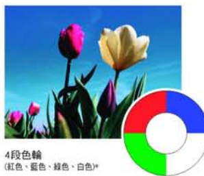
4段色輪 (紅色、藍色、綠色、白色)*