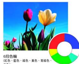
6段色輪 (紅色、藍色、綠色、黃色、青綠色、白色)*