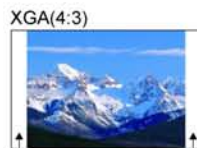
部份畫面無法顯示